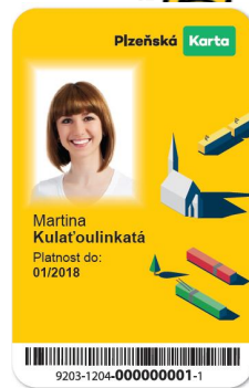
Plzeňská karta klíče k městu